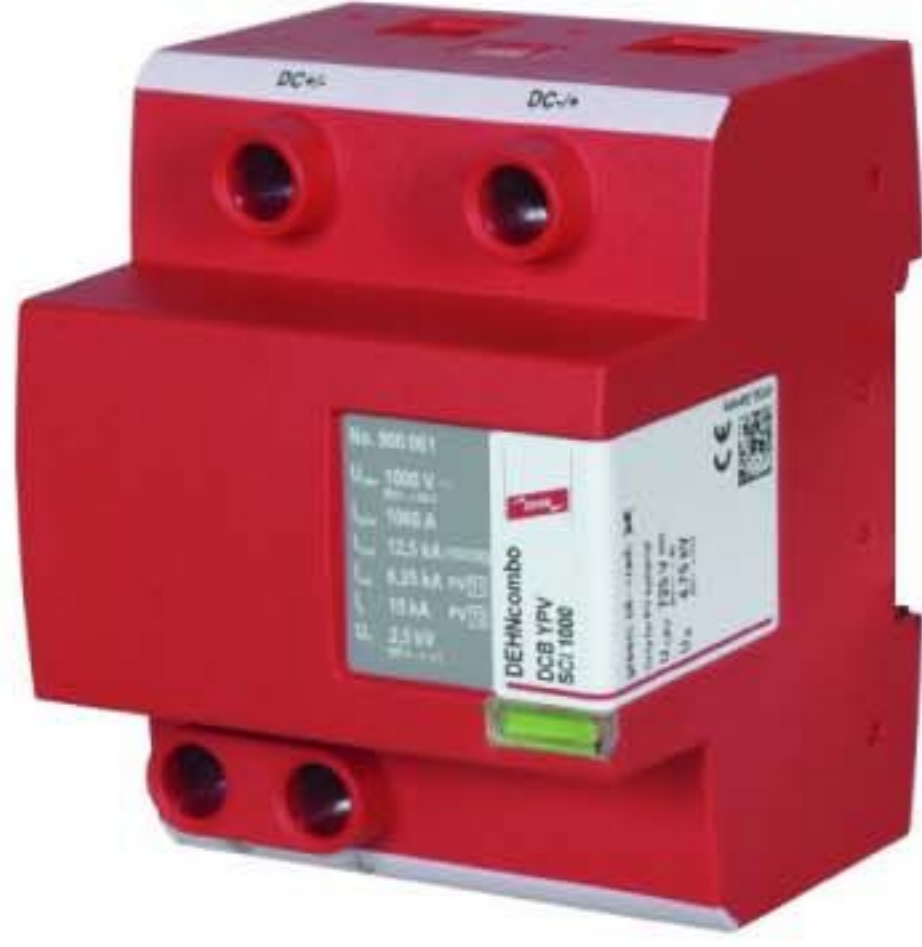
Оригинал может отличаться от изображения