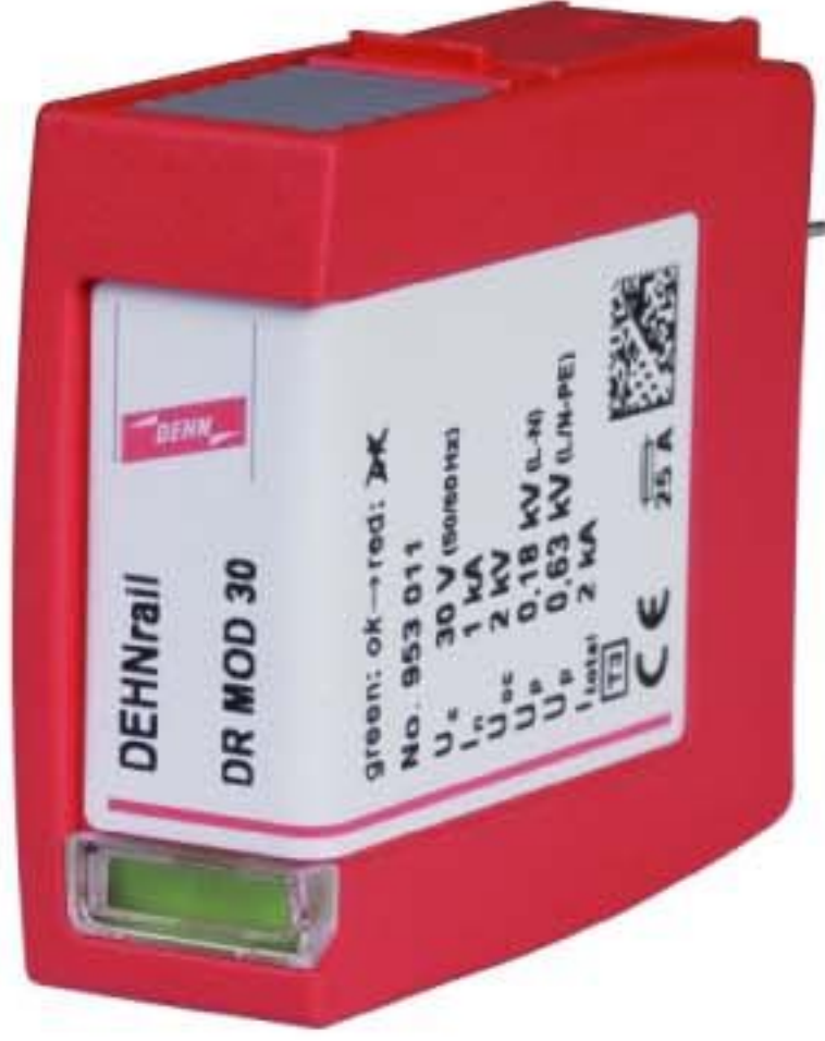
Оригинал может отличаться от изображения