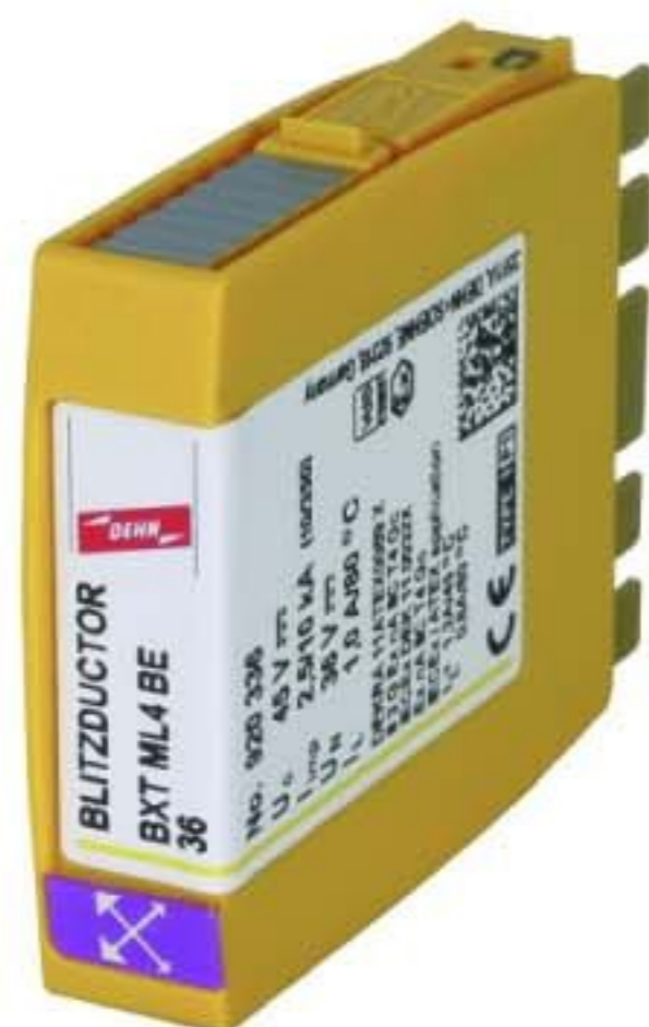
Оригинал может отличаться от изображения