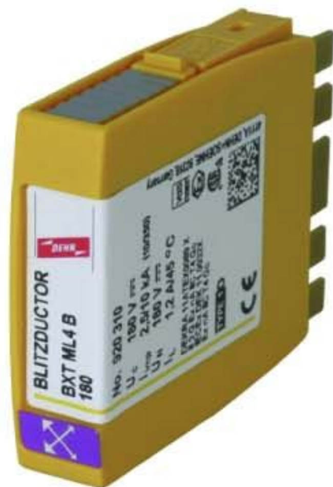
Оригинал может отличаться от изображения