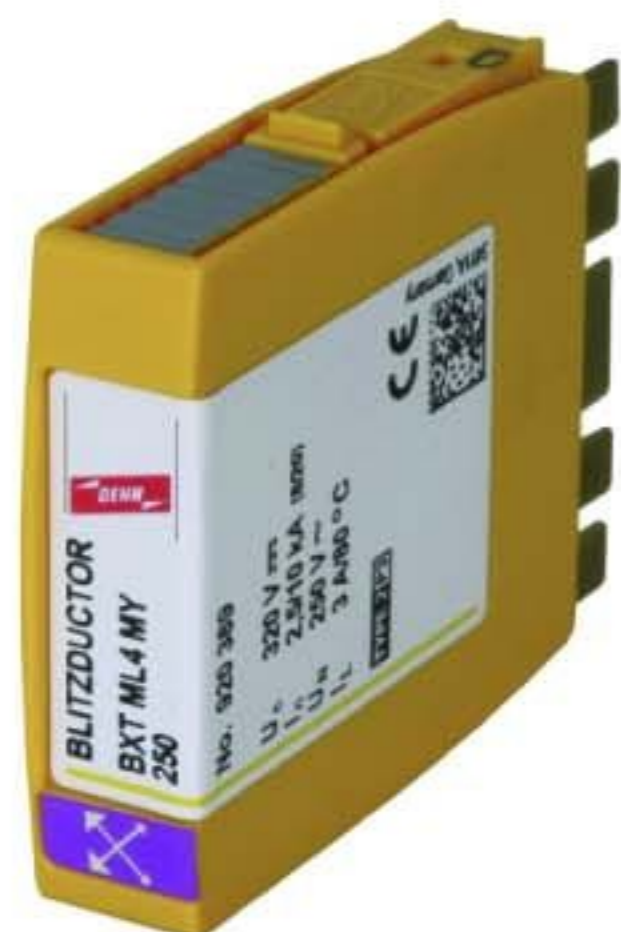
Оригинал может отличаться от изображения