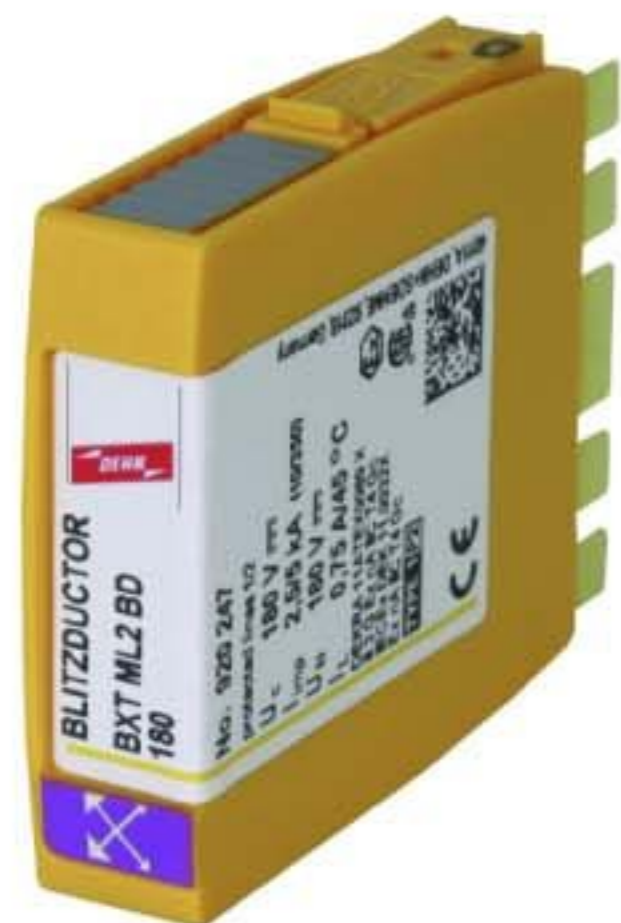
Оригинал может отличаться от изображения