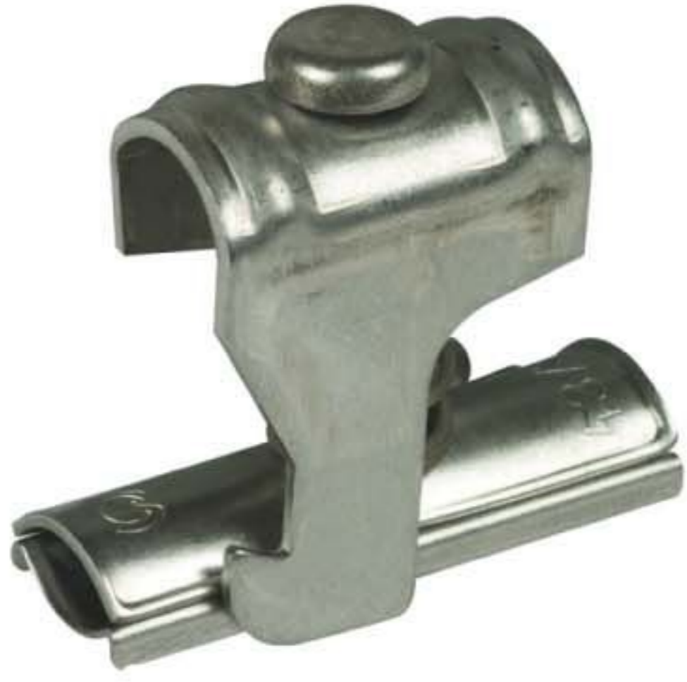
Оригинал может отличаться от изображения