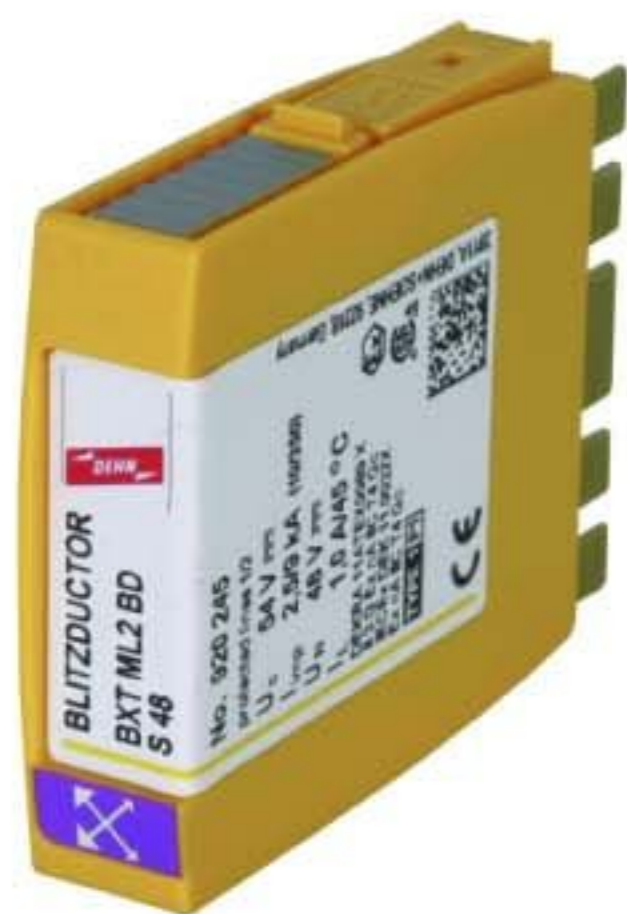
Оригинал может отличаться от изображения