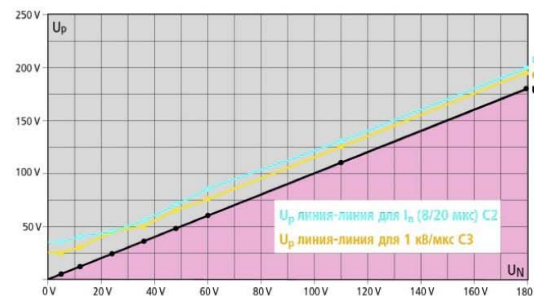
Диаграмма уровня напряжения защиты BXTU

Компактный комбинированный модуль УЗИП с технологиями actiVsense и LifeCheck для защиты 1-й пары. Прямое или не прямое заземление экрана. Автоматически определяется номинальное напряжение сигнала и оптимально подстраивается к нему уровень напряжения защиты.