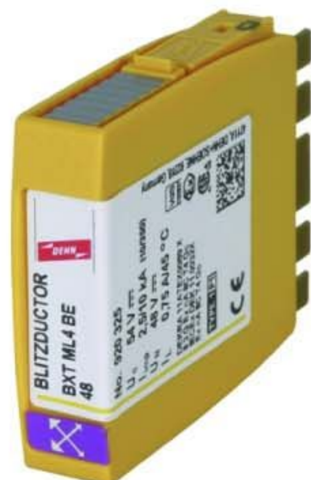
Оригинал может отличаться от изображения