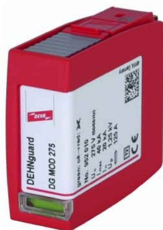
Оригинал может отличаться от изображения