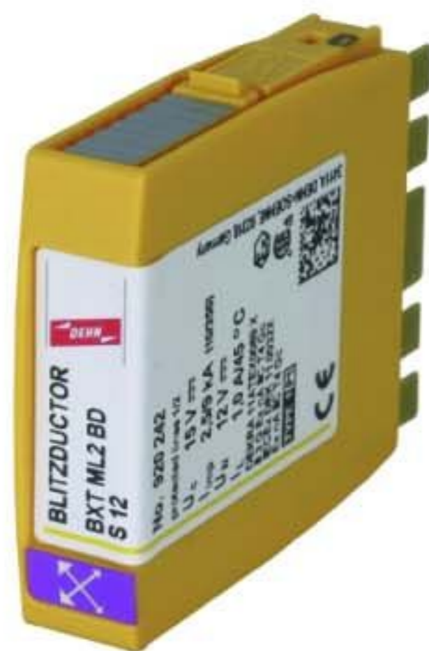
Оригинал может отличаться от изображения