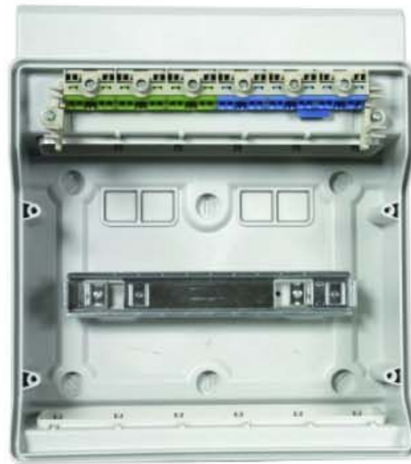
Корпус имеет встроенные клеммные блоки для проводников N и РЕ.