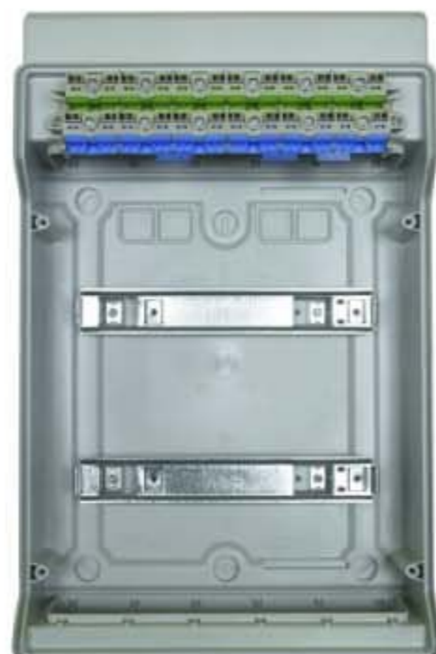
Корпус имеет встроенные клеммные блоки для проводников N и PE.