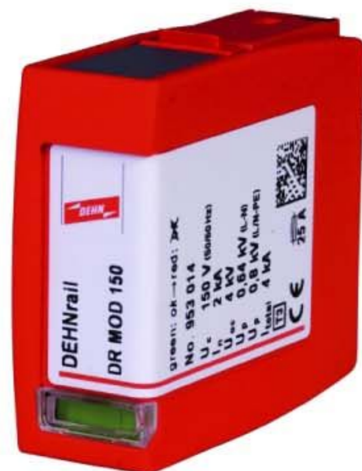
Оригинал может отличаться от изображения