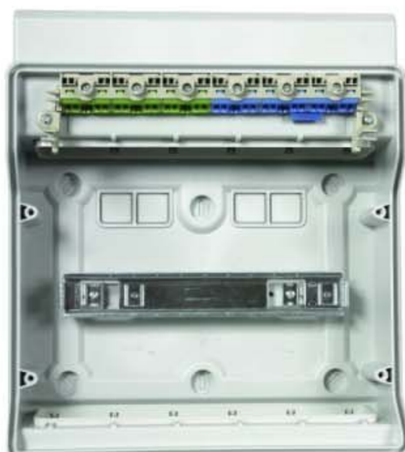
Корпус имеет встроенные клеммные блоки для проводников N и PE.