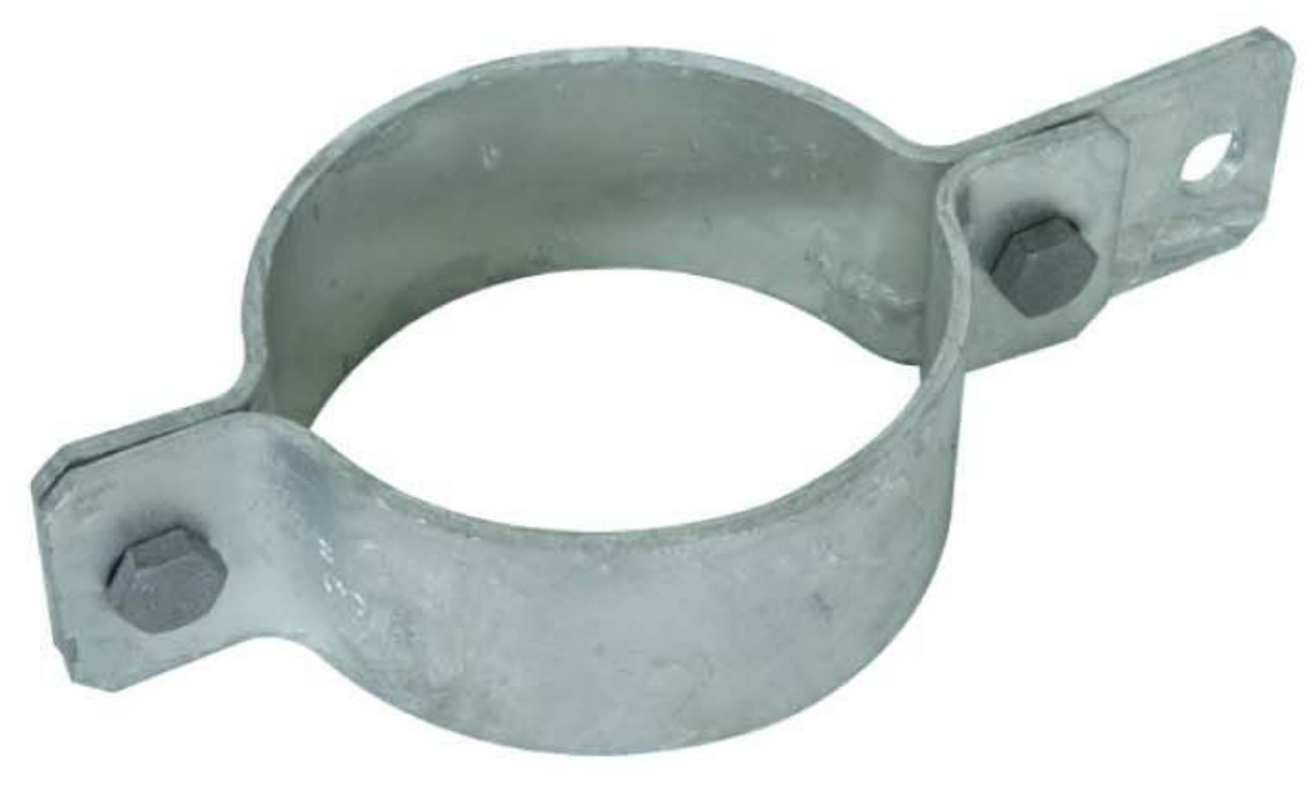
Оригинал может отличаться от изображения